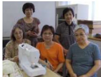
↑ 当日、講師を務めてくださる 手作りボランティアのみなさん