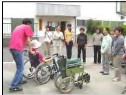
【車椅子操作についての出前講座】

地域包括支援センター（上白根地域ケアプラザ内）では、自治会・町内会やサークル、ボランティアグループ、シニアクラブなど各種団体を対象として、 出前講座 を実施しています！！