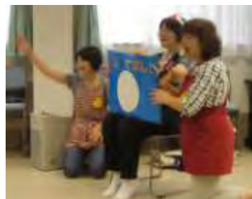
旭北地区子育て支援委員会“A2ライン”による「七夕まつり」の様子 →

自治会町内会長や民生委員・児童委員などの参加者からは、今行っている取り組みや、生活していて感じていること、今後旭北地区がどうなってほしいか、など活発な意見が交わされました。今後、第二回、第三回の開催も予定されており、引き続き積極的な取り組みが展開される予定です。