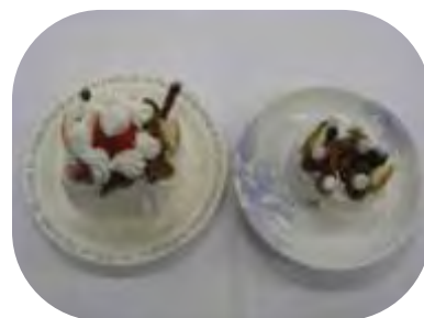
過去の実績：おやつ作り 「クリスマスケーキ」