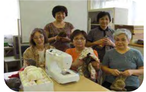
↑ 手作りボランティアのみなさん