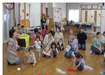
↑ ママも子どもも頑張りました！

10月31日、かみしらね 親子 de イベント「ハロウィンちびっこ運動会」が親子サークル遊さんの全面協力により開催されました。当日は遊さんメンバーも含め、40名のご参加をいただき、紙芝居の読み聞かせ、手遊び、玉入れ、箱リレー、障害物競走と盛りだくさんで、楽しみました。遊さんお手製のハロウィンマントやメダルも大好評でした。