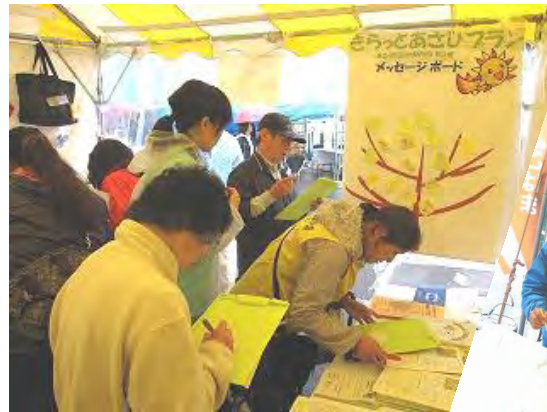
↑ たくさんの方のメッセージを いただきました！

10月20日旭区民まつりが開催され、区内ケアプラザ・区役所・区社協でPR活動を行いました。寒い雨のため、13時に終了となってしまいましたが、50名の方に地域福祉保健計画に対するメッセージや、住んでいる地域の良いところや要望等を記入いただきました。また、子向けにスライムづくりのブースを設け、ケアプラザのPRを行い30名の皆さんに参加いただきました。ありがとうございました。