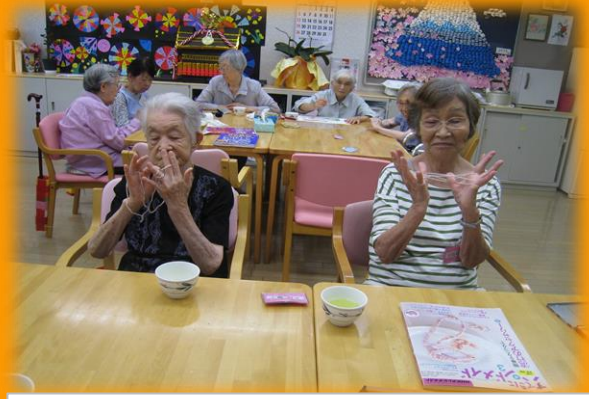
あやとりを選んだ方々で「あやとり合戦」が始まりました！