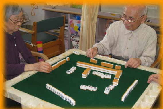
麻雀好きな方は健康麻雀を選び、自分達で牌を積み、勝負します。