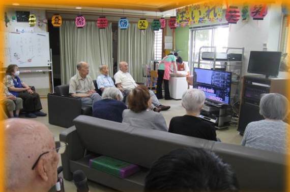
カラオケを選んだ方同士で順番決めや選曲を行います。