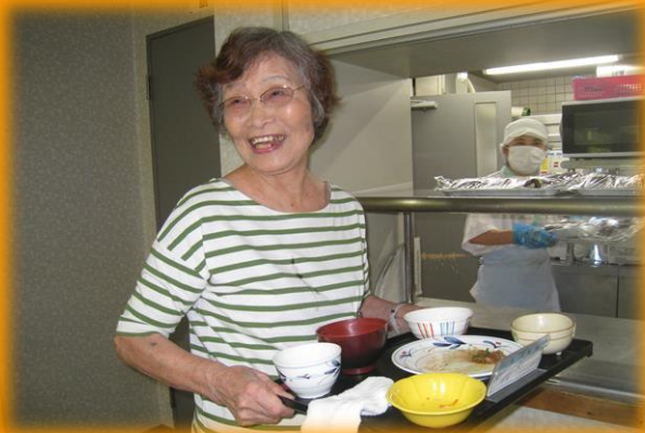
下膳ができる方は、ご自身で下膳します。

長津田地域ケアプラザでは、「できる限り住み慣れた地域で過ごし続けられる」ように、自立支援に向けた取組を進めています。決まったプログラムに沿って動くのではなく、ご利用者自身が「できること」を選んで一日を過ごします。この取組を通じて、ご利用者の「できること」の幅が広がり、自宅での生活を生き生きと過ごしていただくことを目指しています。職員はご利用者の「できること」は奪わず、「できないこと」のみを支援します。この取組により、ご利用者同士が「あやとり合戦」を始める等、新たな一面が窺えました。現在は、曜日を限定して取組んでいますが、段階的に全曜日で取組んでいきます。