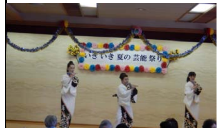
平成26年度夏 いきいき芸能まつり風景

お楽しみのいきいき春の芸能まつりが開催されます。 3月7日（土）・8日（日） 大広間にて：9：15分～