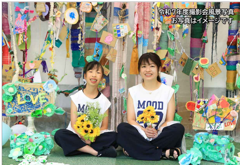
令和7年度撮影会風景写真 お写真はイメージです