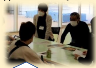
まずは、自己紹介から。

10月28日に、横浜市民ギャラリーあざみ野との共催で、美術鑑賞と交流会を実施しました。コロナ禍でもあり、高齢などで、外出の機会が減ってきています。アートギャラリーという、ふだんとは違う空間で、認知症の方やその家族、高齢の方などだれもが集える外出の場やつながりの場の一つとして、企画しました。「普段と違う場所にきて、アートを見て、楽しんだ」「また、参加したい」など好評のうちに終えることができました。