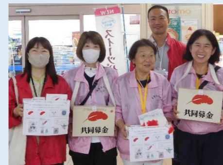
赤い羽根共同募金街頭募金

「民生委員」は、厚生労働大臣から委嘱された非常勤の地方公務員です。社会福祉の増進のために、地域住民の立場から生活や福祉全般に関する相談・援助活動を行っており、創設から100年の歴史を持つ制度です。また、全ての民生委員は「児童委員」も兼ねており、妊娠中や子育ての様々な相談や支援を行っています。地域社会のつながりが薄くなっている中、民生委員・児童委員が地域住民の身近な相談相手となり、支援を必要とする住民と行政や専門機関をつなぐパイプ役を務めています。