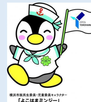
横浜市版民生委員・児童委員キャラクター 「よこはまミンジー」