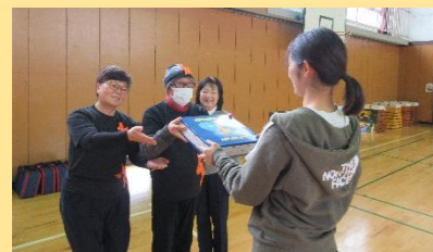
【オレンジロバの贈呈♪】

荏田地区社会福祉協議会による「ボランティア手芸サロン」で作っていただきました！子どもたちからも「かわいい！」と好評でした。