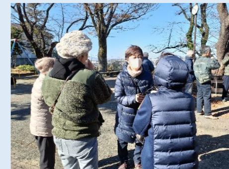
地域活動での見守り