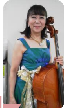
演奏 フェリーチェ