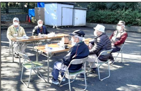
公園の一面を活用！

写真にあるパーテーションは瀬谷区民活動センターで区民団体向けに貸し出ししています！ (問合せ) 瀬谷区民活動センター 369-7081