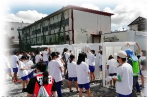
はまっこトイレ組み立て