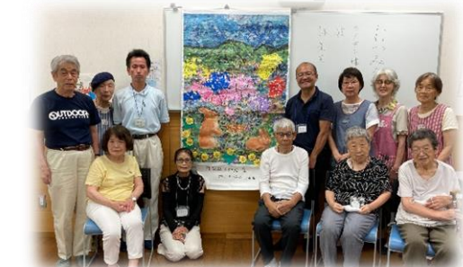
【集合写真】 みんなで作ったちぎり絵作品とともに

旭北むつみ会では、一緒に活動する仲間を募集されています。仲間が欲しい、一緒に運動やお出かけをしたい、空いている時間に体を動かしたい など、ご興味のある方は見学・体験も可能ですので、お気軽にケアプラザまでお問い合わせください。