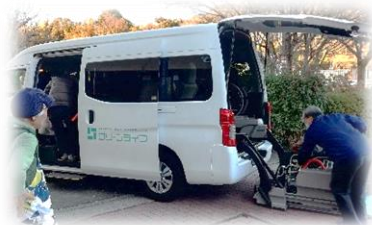
【送迎車への乗車場面】

続いて、特別養護老人ホームグリーンライフによる取組のご紹介です。令和4年度にグリーンライフから福祉施設の地域貢献として、まちぐるみ福祉推進会議において「施設の送迎が空いている時間の送迎車活用」をご提案くださいました。同じころに、旭北むつみ会から「メンバーの高齢化や体の不調などにより、ケアプラザまで来ることが難しくなってきた」という声があり、グリーンライフによる旭北むつみ会への送迎支援が実現しました。現在、月2回の旭北むつみ会の活動時間に合わせた往復送迎を行っています。