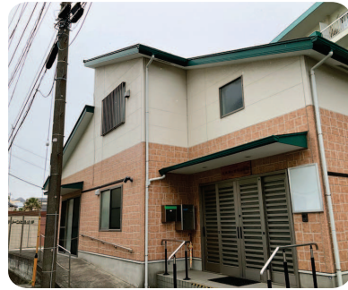
本牧緑ヶ丘自治会館