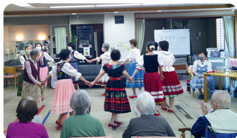
歌・フォークダンス