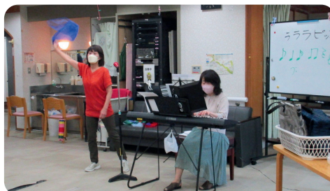
音楽に合わせた体操 など