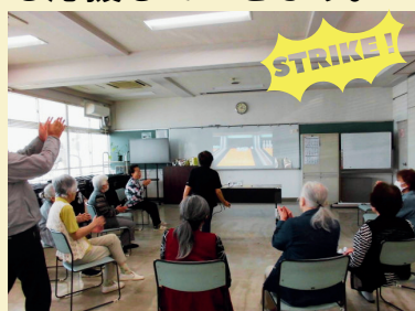
チーム戦は大盛り上がり！ ハイスコアの接戦となりました。