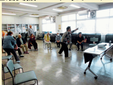
ボウリング世代のみなさん、さすがの投球フォームです。

人と人とのつながりは、健康に良い影響を与えることが明らかになっています。このような場が介護予防や孤立防止となっていくます。いぶきの会のような温かい場がこれからも続くよう、生活支援コーディネーターも応援していきます。