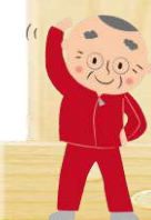
大広間から…紅葉のひとコマ

当面、カラオケ・舞台の利用はできませんが、おなじみの当館スタッフが登場する体操の動画を上映しています。一緒に体を動かしませんか？ほかにも脳トレやヨガなどを企画中。みなさまのご来館をお待ちしています。お風呂は再開に向けて準備中です。もうしばらくお待ち下さい。