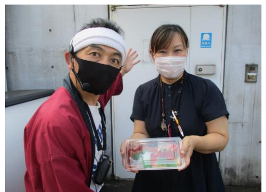
ケアプラザ脇でも 11時20分頃から販売しています♪