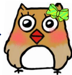
イメージキャラクター いずみちゃん

地域ケアプラザは、介護の悩みなど生活の困りごとの総合相談窓口です。 ご相談の際は、事前にご連絡いただくと助かります。 相談時間は、9時～17時です。第4月曜日は、休館日になります。