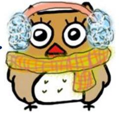
イメージキャラクター しもずく