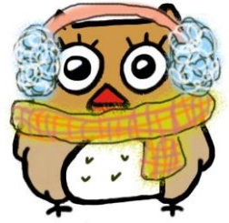
イメージキャラクター しもずく