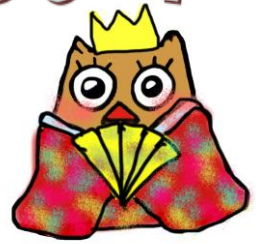
イメージキャラクター しもずく