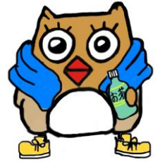
イメージキャラクター しもずく

地域ケアプラザは、介護や生活の困りごとの総合相談窓口です。 ご相談の際は、事前にご連絡いただくと助かります。 窓口でのご相談は、9時～18時の間で対応します。 第4月曜日は、休館日です。