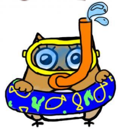
イメージキャラクター しもずく

地域ケアプラザは、介護や生活の困りごとの総合相談窓口です。 ご相談の際は、事前にご連絡いただくと助かります。 窓口での相談は、9時～18時の間で対応します。 第4月曜日は、休館日です。