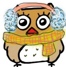
イメージキャラクター しもずく

地域ケアプラザは、介護や生活の困りごとの総合相談窓口です。 ご相談の際は、事前にご連絡いただくと助かります。 窓口でのご相談は、9時～18時の間で対応します。(日・祝は17時まで) 第4月曜日は、休館日です。