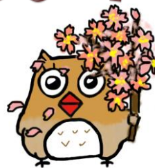
イメージキャラクター しもずく

地域ケアプラザは、介護や生活の困りごとの総合相談窓口です。 ご相談の際は、事前にご連絡いただくと助かります。 窓口でのご相談は、9時～18時の間に対応します。(日・祝は17時まで) 第4月曜日は、休館日です。