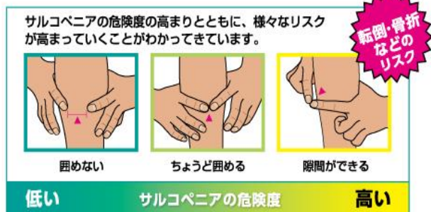
※「指輪っかテスト」は、東京大学高齢社会総合研究機構が実施した柏スタディをもとに考案されました。