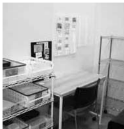
利用者に合わせた環境づくり

※発達障害者地域支援マネジャー発達障害者支援センターに地域支援マネジャーを配置し、事業所からの依頼に基づき、マネジャーが訪問。事業所職員から話を聞いたうえで、障害特性の理解や支援方法、関わり方、環境調整等についてコンサルテーションを行う。