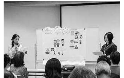
帆海のスタッフによるパネルシアター

か、具体的な答えがほしいという方も多かった」と振り返る。そこで、福祉制度などを学ぶ『セミナー』に加え、参加した家族同士が意見交換を行う『ワークショップ』と専門家による『無料相談会』を新たに始めた。