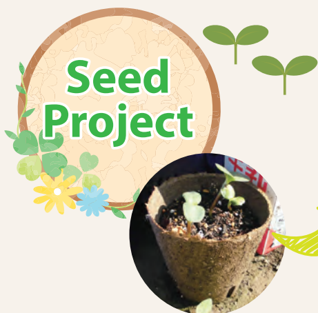
事業所から小学校に種を寄付 苗を育てました

磯子区の生活介護事業所、いそご青い鳥(以下、事業所)では、昨年近隣の汐見台小学校とコラボしてひまわりを育てる「Seed Project」を行いました。事業所から寄付した種を生徒さんが植えて10cm~15cm位まで育て、最後は事業所前の花壇に移植。きれいに花を咲かせました。