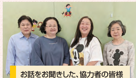
お話を伺った、協力者の皆様