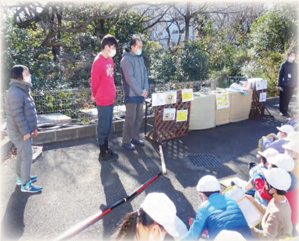
小学2年生の町探検の青空授業。