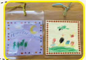
ハロウィンカード

小学校との関わりの他、地域の防災に関する会議への参加、災害時に利用できる雨水タンクの整備等、地域の一員として防災に関する取組みを始めています。また、事業所周辺は住宅街で夜は暗くなってしまうため、防犯対策として事業所周囲のフェンスにライトの設置もおこなう等、地域に目を向けることを意識して活動しているそうです。