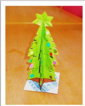
ご利用者様が作ったクリスマスツリー 他にも色々な作品を作っています