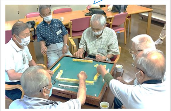
ボランティアさんと一緒に健康麻雀も出来ます