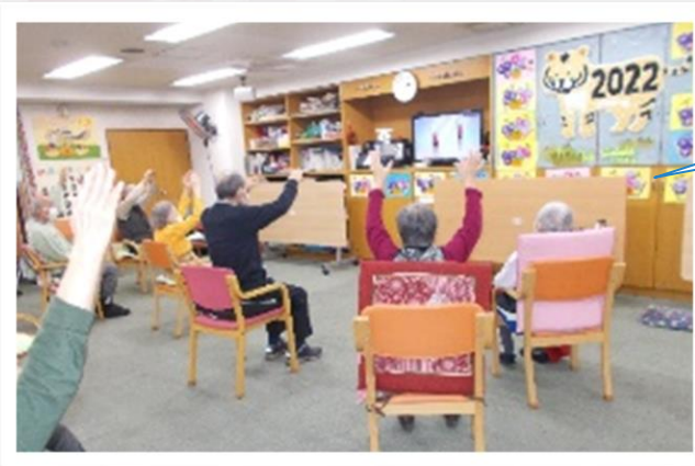
みんなで、元気に健康体操をしています