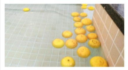
時期になると柚子湯も楽しめます