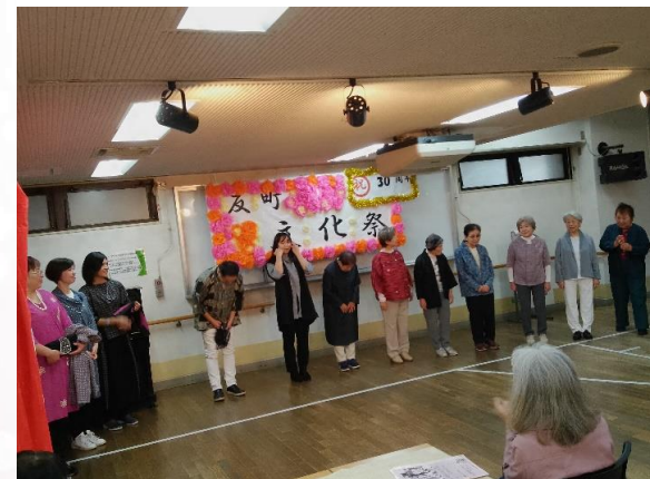
反町第一町内会 ソーイングサークル