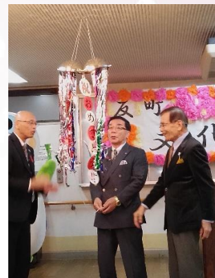
お祝いのくす玉割の瞬間！！ とても盛り上がりました！！