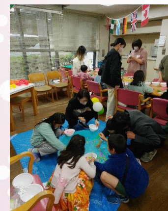
お子様向けブース