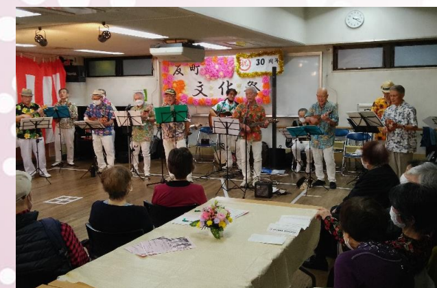
ウカレしおやじーず