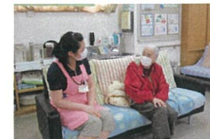
なるべく距離を おいての会話