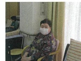
ご利用者様も マスク着用