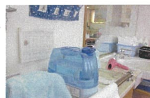
感染予防の 消毒剤使用の加湿器

状況により、サービス提供時間・プログラム変更等を行わせていただく場合がございます。