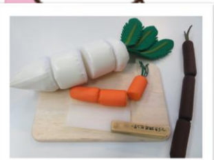
布おもちゃには発達を促す しかけがいっぱいです！

楽しく遊びながら手や指の訓練 知能・感覚の発達を促す 手づくりの 「布おもちゃと木のおもちゃ」 を貸出しております！