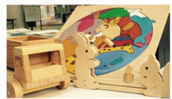
木のおもちゃ は五感を刺激 し、集中力を 育むと言われ ています

楽しく遊びながら手や指の訓練 知能・感覚の発達を促す 手づくりの 「布おもちゃと木のおもちゃ」 を貸出しております！