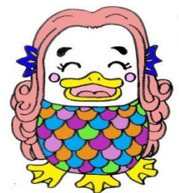
アマビエ ♡ ダリア