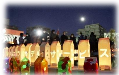
牛乳パックでつくるホルダー