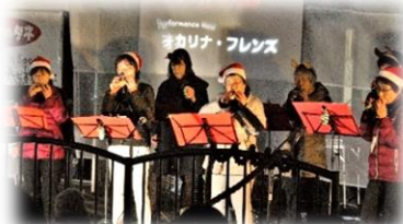
オカリナフレンズ