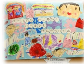
プレゼントされた絵

6月末に、「入船の森保育園」の園児さんが訪問され、交流会を行いました。ダンスを披露してくださり、利用者様へ絵のプレゼントもいただきました。そのかわいらしい姿に利用者様も癒されました。次の機会も楽しみにしています。