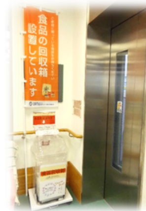
1階エレベーター前

区内ケアプラザなどで食品の回収ボックスを設置しているフードドライブ（不要な食品を寄付する活動）ですが、6月で当館に設置開始から2年が経ちました。回収ボックスは1階エレベーター横に設置されています。これまでのご協力に感謝申し上げます。