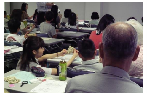
本物そっくりのお札を使って、お札を正しく数える体験。

企業活動の一環として実施している面もあるので、体験を通じて《よこしん》が生活の中にあることを知ってもらうこと、子どもたちが将来、《よこしん》に口座を開くなどの取引が生まれることも期待しています。より多く「楽しかった」という感想をいただけるようにアレンジしながら、今後も続けていきたいと思っています。