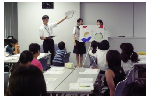
紙芝居のストーリーに沿って、主人公になったつもりで、お小遣いの計画的な使い方を学びます。