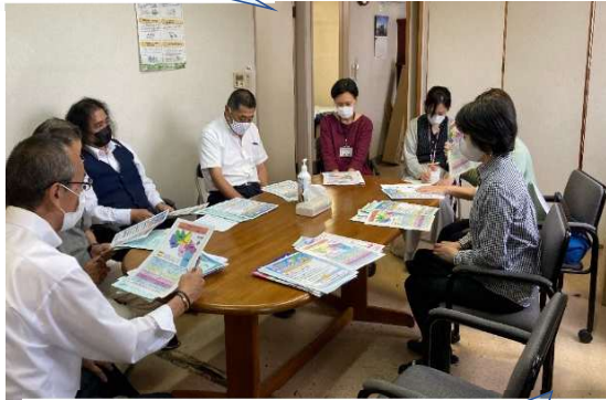
オペレーターさんとの情報交換