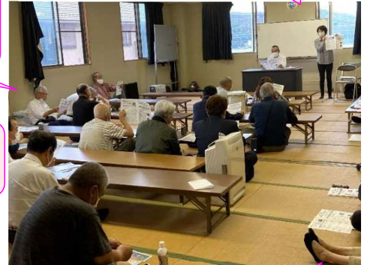
ドライバーさんとの情報交換