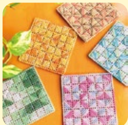
デザイン・色はおまかせください

工房アリアーレは旭区の二俣川銀座商店街にあり、中途障害者の方が自主製品の製作と販売をしています。お気軽にお立ち寄りください。