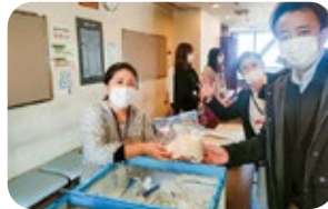
▲会議等の際にお持ちいただきました