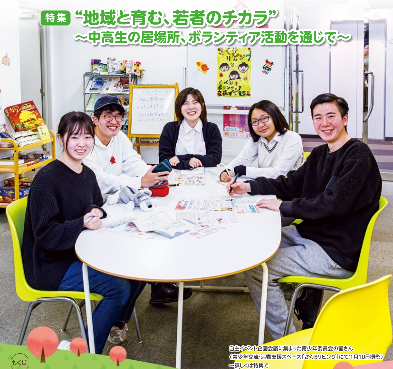
自主イベント企画会議に集まった青少年委員会の皆さん (青少年交流・活動支援スペース「さくらリビング」にて:1月10日撮影) →詳しくは特集で