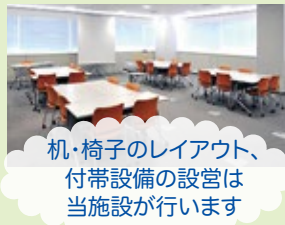
机・椅子のレイアウト、付帯設備の設置は当施設が行います

4~240名まで収容可能な研修室、実習室、和室など30室を備えています。打ち合わせ、研修、会議と幅広い用途でご利用いただけます。ぜひご利用ください。 ※有料・要事前予約