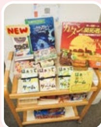
▲人気のボードゲーム

設備 フリースペース(交流コーナー・学習コーナー)、ミーティングルーム、研修室、音楽スタジオ、多目的ルーム