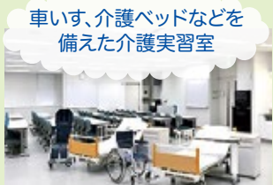
車いす、介護ベッドなどを備えた介護実習室