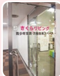
▲いつでもふらっとどうぞ