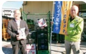
▲フードバンクかながわにお届けしました