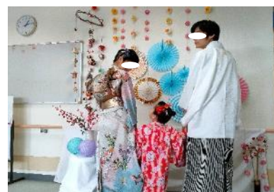
七五三プロジェクト

ひとり親家庭等で七五三のお祝いや家族で着物を着て写真を撮る機会が無い等の声を受け、地域ケアプラザや地区社協等とともに着物を着て写真を撮る取組を実施しました。当日の着付けはボランティアグループきものっこに協力いただきました。イベントの開催にあたっては、身近な地域でのつながり・支えあいを意識し、地区社協等の地域住民にもご参加いただくことで、生活困窮世帯と地域のつながりの創出及び関係性の構築を行いました。【実績】6世帯