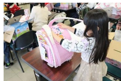
ランドセルお渡し会

ひとり親家庭や生活困窮世帯等がランドセルの購入費用を捻出できないという課題に対し、新1年生を迎える子ども達に「自分で選んだランドセル」を寄贈しました。【実績】21人