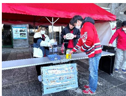
出店ブースの様子(12月22日)