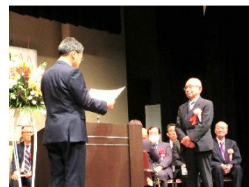
感謝の集い 式典の様子