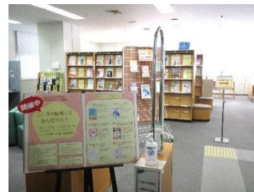
企画展「こころの病気ってなんだろう？」