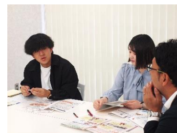
学生ライターの取材風景

若い世代が「福祉よこはま」に関心を持ち、地域福祉や地域活動に役割をもって関わられるきっかけづくりとして学生による取材体験を実施しました。