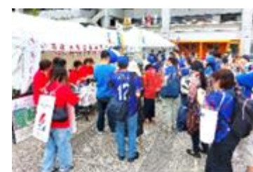
出店ブースの様子(5月3日)