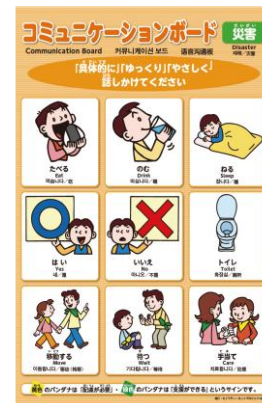
災害用コミュニケーションボード