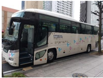
福祉バス あおぞら1号