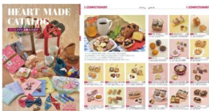
販売カタログ(デジタルブック)

地域活動支援センター作業所型等の自主製作品を「ハートメイド」ブランドで通信販売するとともに、ふれあいショップや地域のイベント等での展示販売を行い、作業所等の活動を広く市民に紹介しました。※ふれあいショップでの委託販売:6か所(新規取扱1、閉店1)