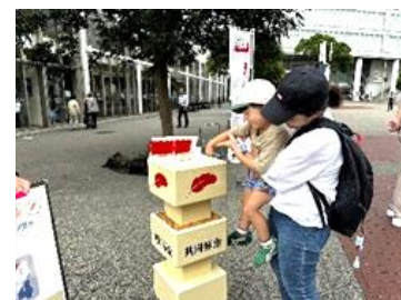
街頭募金呼びかけ