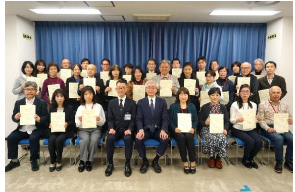
第7期横浜市市民後見人養成課程(実務編)