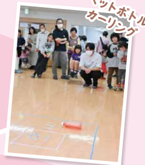
ペットボトルカーリング

ペットボトルカーリングを担当しました。SNSで調べたり、流行りのゲームを取り入れたりして、みんなが楽しめるよう企画しています。昨年度、中高生ボランティアグループを結成しました。今日いないメンバーも含めて、みんなの会の活動やその他イベントの企画運営を頑張ります。