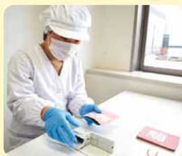
▲一点一点、手作業で

「ゆたかカレッジ Y.Y.WORK」は、戸塚区戸塚町にある就労継続支援B型事業所です。はたらくことの「やりがい」や「楽しさ」を感じながら、販売を通して社会とつながる喜びを大切にしています。季節の風味を活かしたコーヒーは、日常に癒しと活力を与えてくれます。お湯をそそぐだけの簡単なドリップタイプのコーヒーです。