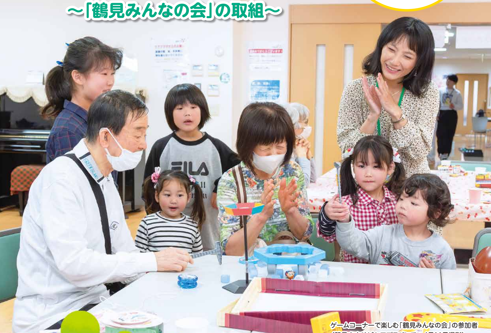
ゲームコーナーで楽しむ「鶴見みんなの会」の参加者 (鶴見中央地域ケアプラザにて: 4月11日撮影) →詳しくは特集で