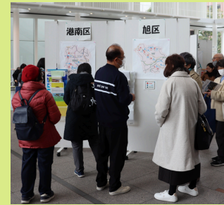
展示ブースの様子