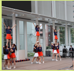
学生ボランティアによるステージ発表