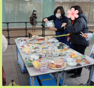
体験コーナー（食事診断・とろみ体験）