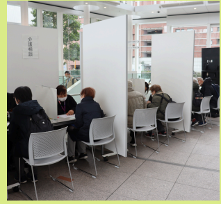
相談ブースの様子