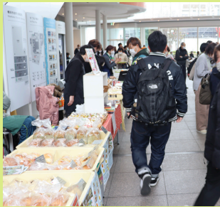
販売ブースの様子