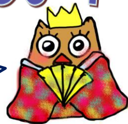
イメージキャラクター しもづく