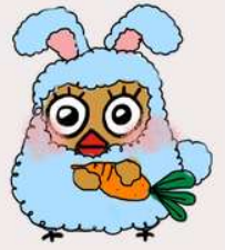
イメージキャラクター しもずく

地域ケアプラザは、介護や生活の困りごとの総合相談窓口です。 ご相談の際は、事前にご連絡いただくと助かります。 窓口でのご相談は、9時～18時の間に対応します。(日・祝は17時まで) 第4月曜日は、休館日です。(祝日の場合は翌日の火曜日) 6月は6月22日(月)が休館となります。