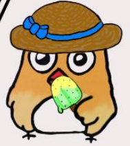
イメージキャラクター しもずく

地域ケアプラザは、介護や生活の困りごとの総合相談窓口です。 ご相談の際は、事前にご連絡いただくと助かります。 窓口でのご相談は、9時～18時の間に対応します。(日・祝は17時まで) 第4月曜日は、休館日です。(祝日の場合は翌日の火曜日) 7月は7月27日(月)が休館となります。