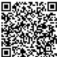
申込用二次元コード