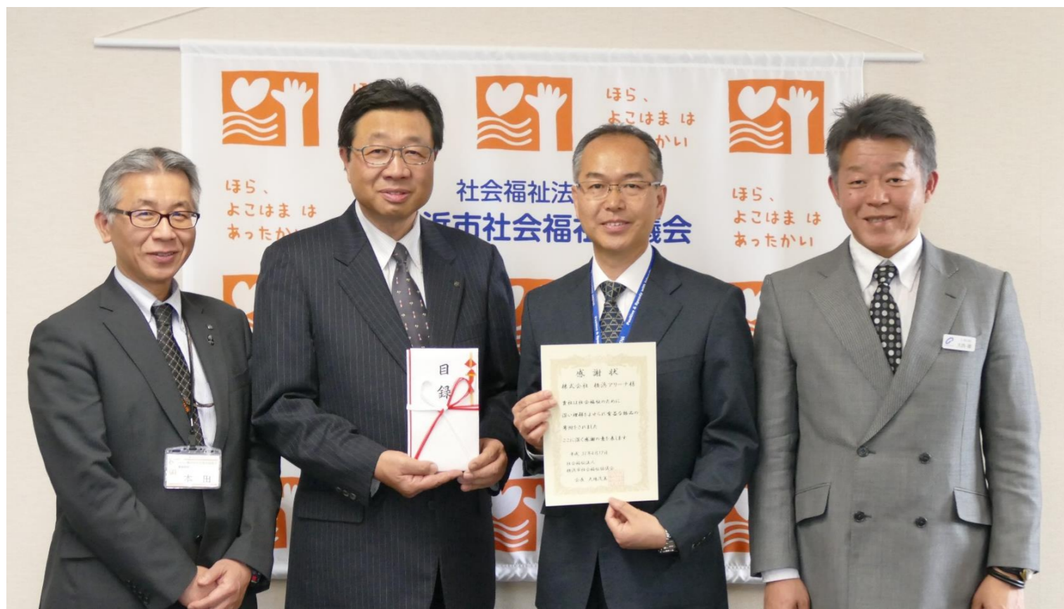
本会 本田事務局長