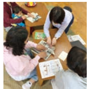
定期開催の おやこにほんごくらぶの様子

外国につながる子ども達とその家族への支援は今後さらに必要になると考えられます。日本人も外国人も地域で安心して生活し、子育てができるよう、外国人当事者の経験や特技も生かして、地域でともに生きる「多文化共生社会」を実現していきたいと思えます。