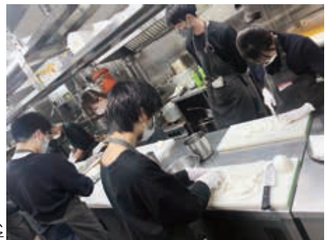
シェフの指導のもと、みんなで調理している様子

各取組の詳細や寄付を受け取った方からのメッセージ、その他の取組についてはこちらの二次元コードからヨコ寄付特設サイトをご覧ください。