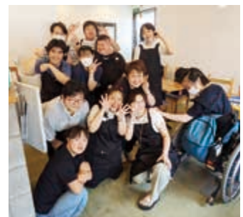
メンバーの皆さんの活動の様子

「よこはまふれあい助成金」は、私たちが取り組んでいる生きづらさを抱えた子どもや若者への支援活動費として利用させていただきました。皆様のお力添えがあってこそ、私たちの取組が実を結び、地域に貢献することができていると思っています。今後も地域の課題解決に向け、私たちは取組を続けてまいります。今後ともご支援を賜りますようお願い申し上げます。