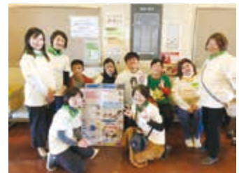
発表会が無事終わり、 みんなで記念撮影