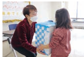
自分で選んだランドセルをプレゼント