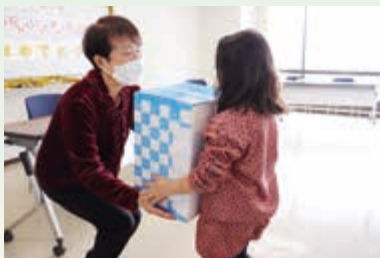
寄付を活用した支援事業