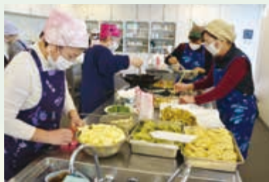
地域の活動団体へ助成金の配分 (一人暮らし高齢者への支援等)