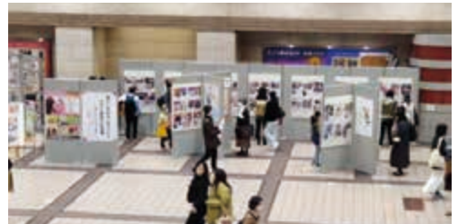
新都市プラザでの写真展の様子