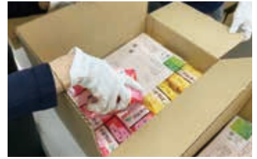
配布した生理用品

また、令和3年度に実施したアンケートの内容を踏まえ、生理に関する悩みなどのLINE相談窓口を開設しました。