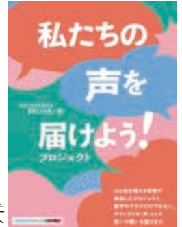
若者の声をまとめたリーフレット

また、ワークショップ及び事前アンケート（108名が回答）で集まった声を基にリーフレット及びHPを作成しました。