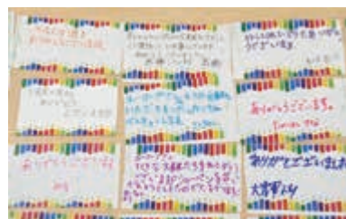
文房具を受け取った子ども達からのメッセージ