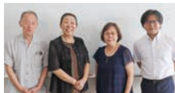
児童福祉部会 部会長・副部会長