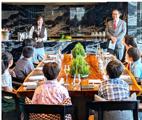
*テーブルマナー教室 本格的なカトラリーを使用してランチフルコースを体験