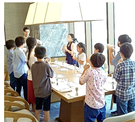
*モクテル作り カクテルシェイカーを振ったら完成！