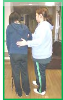
腰の位置を支える